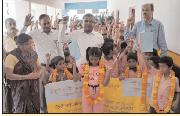
स्कूल चलो अभियान व मतदाता जागरूकता रैली को जिला बेसिक शिक्षा अधिकारी ने हरी झंडी दिखाकर किया रवाना