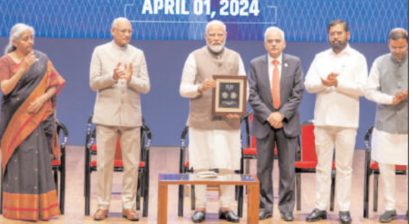
आरबीआई गवर्नर ने पीएम नरेंद्र मोदी के द्वारा सिक्का लॉन्च कराया

मुंबई। भारतीय रिजर्व बैंक आज अपना 90वां स्थापना दिवस समारोह मना रहा है। इस अवसर पर मुंबई के नरीमन पॉइंट स्थित नेशनल सेंटर फॉर परफॉर्मिंग आर्ट्स (एनसीपीए) में एक भव्य समारोह का आयोजन किया गया है। इस अवसर पर प्रधानमंत्री नरेंद्र मोदी ने अपने संबोधन में कई बड़ी बातें कही हैं। पीएम मोदी ने कहा कि आज भारत का रिजर्व बैंक एक ऐतिहासिक पड़ाव पर पहुंचा है। आरबीआई ने अपने 90 साल पूरे किए हैं, एक संस्थान के रूप में आरबीआई आजादी के पहले और आजादी के बाद का गवाह है। आज पूरी दुनिया में आरबीआई की पहचान उसके प्रोफेशनलिज्म और कमिटेमेंट की वजह से बनी है। मैं आप सभी को आरबीआई की स्थापना के 90 साल पूरे होने की बधाई देता हूँ। पीएम मोदी ने आगे कहा कि आज आप जो नीतियां बनाएंगे, जो काम करेंगे उनसे आरबीआई के अगले दशक की दिशा तय होगी। ये दशक इस संस्थान को उसके शताब्दी वर्ष तक ले जाने वाला दशक है और दशक विकसित भारत की संकल्प यात्रा के लिए भी उत्तम ही अहम है। आने वाला दशक इस संस्थान को इसकी शताब्दी वर्ष तक ले जाने वाला है। मैं आरबीआई को उसके लक्ष्यों और संकल्पों के लिए बधाई देता हूँ।