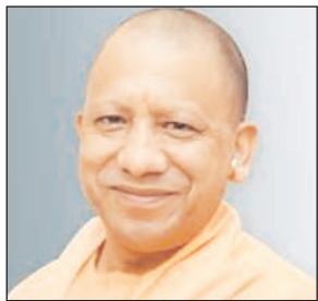
लोकसभा क्षेत्र में 1100 सदस्य चयनित किये गए हैं।

इस अभियान के तहत भाजपा शिक्षक, चिकित्सक, अधिवक्ता, शिक्षण संस्थान प्रमुख, व्यावसायिक केंद्र, व्यापारी, सामाजिक संगठनों के प्रमुख, अवकाश प्राप्त अधिकारियों, पूर्व सैनिकों, उद्योगपतियों, चार्टर्ड अकाउंटेंट, प्रवासी भारतीयों, साहित्यकारों, स्तंभकारों, कवियों, धार्मिक अध्यात्मिक प्रमुखों सहित विभिन्न सामाजिक, धार्मिक व व्यवसायिक क्षेत्रों से जुड़े लोगों से संघर्ष करेगी और सेमिनार के माध्यम से संवाद करेगी। अभियान को क्रियावित करने के लिए प्रत्येक