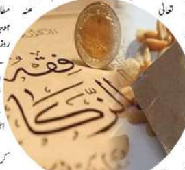
زکوٰۃ کی رویت پر توجہ دینی اور اس سلسلہ میں منظم کوشش کی ضرورت ہے۔

استقامت ہو سکتا ہے۔ اجتماعی عمل اللہ تعالیٰ کو محبوب ہے۔ جس طرح باجماعت نماز اور زکوٰۃ سزاگاہ ہے۔ اسی طرح زکوٰۃ باجماعت ہی انجام دینی اور شوق مند بننے کے لیے اجتماعی اہتمام ہی بہتر ہے۔ نماز کی طرح زکوٰۃ کا انتظام بھی اجتماعی ہو۔ ہلال کی رویت پر توجہ دینی اور اس سلسلہ میں منظم کوشش کی ضرورت ہے۔ ہلال کی رویت پر توجہ دینی اور اس سلسلہ میں منظم کوشش کی ضرورت ہے۔ نماز کی طرح زکوٰۃ کا انتظام بھی اجتماعی ہو۔ ہلال کی رویت پر توجہ دینی اور اس سلسلہ میں منظم کوشش کی ضرورت ہے۔ ہلال کی رویت پر توجہ دینی اور اس سلسلہ میں منظم کوشش کی ضرورت ہے۔ نماز کی طرح زکوٰۃ کا انتظام بھی اجتماعی ہو۔ ہلال کی رویت پر توجہ دینی اور اس سلسلہ میں منظم کوشش کی ضرورت ہے۔ ہلال کی رویت پر توجہ دینی اور اس سلسلہ میں منظم کوشش کی ضرورت ہے۔