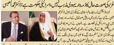
غزہ: (اے پی پی)۔ ایلہ عامر اسرائیلی کے سرکاری بول چال کو ٹھکرانے والے فلسطینی شہداء کی تعداد کو 33207 بتا رہی ہیں۔ ان کی فوج کے جاری کردہ بیان کے مطابق غزہ میں جاری اسرائیلی بمباری اور فوج کے نتیجے میں اب تک 33207 فلسطینی شہید ہو گئے ہیں۔

غزہ (اے پی پی) - فلسطینی شہداء کی تعداد 33207 ہو گئی ہے۔ اسرائیلی فوج کے جاری کردہ بیان کے مطابق غزہ میں جاری اسرائیلی بمباری اور فوج کے نتیجے میں اب تک 33207 فلسطینی شہید ہو گئے ہیں۔ چھٹے 24 گھنٹوں کے دوران شہید ہونے والے فلسطینیوں کی تعداد 38 ہے۔ یہ بیان کے مطابق 17 اکتوبر سے شروع کیا گیا ہے۔ اس وقت تک فلسطینیوں کی تعداد 75933 ہے۔ وزارت صحت کے بیان کے مطابق شہداء کی تعداد 33207 ہے۔ اس میں 14 ہزار 400 فلسطینی عورتیں اور 14 ہزار 400 فلسطینی بچے شامل ہیں۔ عورتوں اور بچوں کی تعداد 33207 ہے۔