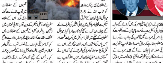
حزب اللہ کے اسرائیلی بمباری کے جواب میں اسرائیلی بستیوں پر درجنوں میزائل حملے

غزہ (جنگنی) حزب اللہ کے اسرائیلی بمباری کے جواب میں اسرائیلی بستیوں پر درجنوں میزائل حملے کیے گئے۔