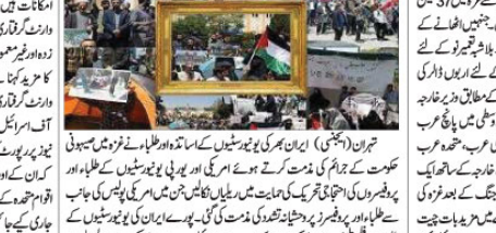
ایران بھری یونیورسٹیوں میں امریکی طلبہ کی فلسطینی حامی تحریک کی حمایت میں ریلیاں

واشنگٹن (جنگنی) ایران بھری یونیورسٹیوں میں امریکی طلبہ کی فلسطینی حامی تحریک کی حمایت میں ریلیاں منعقد ہوئی۔