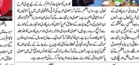
پاکستان اور سعودی عرب کے معاشی تعلقات نئے دور میں داخل ہو چکے ہیں: شہباز شریف

اسلام آباد (جنگنی) پاکستانی وزیر اعظم شہباز شریف نے کہا کہ پاکستان اور سعودی عرب کے معاشی تعلقات نئے دور میں داخل ہو چکے ہیں۔