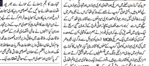
امریکی فوج کی بحیرہ احمر کی فضائی حدود میں پانچ مسلح ڈرون سے جھڑپ

واشنگٹن (جنگنی) اسرائیلی بمباری کے جواب میں حزب اللہ نے اسرائیلی بستیوں پر درجنوں میزائل حملے کیے۔