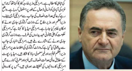
اسرائیلی وزیر خارجہ کیپٹن

غزہ رابطہ گروپ کی عالمی برادری سے اسرائیلی پرومپٹ پابندیاں عائد کرنے کی درخواست □ اسرائیلی مسلح افواج کے سربراہ نے جنگ جاری رکھنے کے منصوبے منظور کر دیئے □ حماس غزہ کی آبادی کو ڈھال کے طور پر استعمال کر رہا ہے: اسرائیلی وزیر خارجہ □ اسرائیلی رنج پر پیش قدمی کے قبل ہمارے خدشات سننے کو تیار ہو گیا: جان کربی