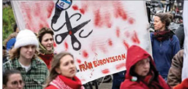
شہریوں کو موسیقی کے بین الاقوامی مقابلے یورو ویژن کے لیے سفر سے روک دیا

مقابلے میں شامل امریکی موسیقی کے خلاف شہریوں پر پابندی لگانے کے لیے انتظامیہ نے ایک ایسے حکم جاری کیا ہے جس کے تحت 186 قوتوں پر پابندی لگائی ہے۔