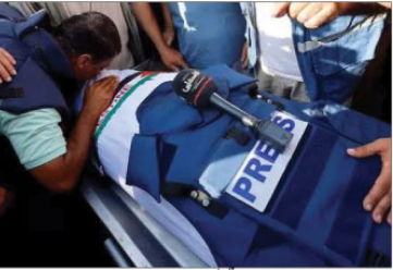
نویسٹکو کا پریس فریڈم پرائز غزہ میں فلسطینی صحافیوں کے نام

غزہ (پینسلی)۔ اقوام متحدہ کے تعینات سائبر ڈیفنس کے ادارے نے نوٹیکو کے فریڈم پرائز میں ان میں انسانی فلسطینی صحافیوں کو پریس فریڈم پرائز سے نوازا۔ امریکہ اور اس کے دو ممالک 6 ماہ سے زائد عرصے سے ہادی جنگ کی کوریج کرتے ہیں۔