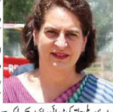
مان کھتی ہیں

بریلی 03 مئی (ای این آئی) کانگریس جرنل مان کھتی ہیں کہ بیمار اخاندان رائے بریلی میں مکمل ہوتا ہے۔ انہوں نے کہا کہ جموں و کشمیر میں پریس پبلٹی فارم کی موجودہ صورتحال انتہائی تشویشناک ہے۔ انہوں نے کہا کہ جموں و کشمیر میں پریس پبلٹی فارم کی موجودہ صورتحال انتہائی تشویشناک ہے۔ انہوں نے کہا کہ جموں و کشمیر میں پریس پبلٹی فارم کی موجودہ صورتحال انتہائی تشویشناک ہے۔