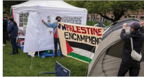
پنسلوانیا یونیورسٹی کی پولیس سے مدد کی درخواست

واشنگٹن (پینسلی)۔ امریکی سین ایئر لائنیاں دی جیٹس کی رپورٹ کے مطابق جیسے کہ روز پورٹیکل آف پنسلوانیا نے امریکی پولیس سے کیوں نہیں ملنے والے فلسطینیوں کے حامی مظاہروں میں اضافہ کرنے کے بعد سزے خواتین کی درخواست کی ہے۔