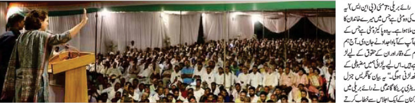
پرینکا گاندھی نے کہا کہ مٹی میں ایک ساگر ہے۔ اس مٹی میں میرے خاندان کا خون ملا ہوا ہے۔