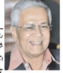
اسلام بن رزاق

اسلام بن رزاق کی سوانح عمری اور زندگی کے بارے میں ایک دلچسپ اور دلچسپ کتاب ہے۔ اس کتاب میں رزاق کی زندگی کے مختلف مراحل اور ان کی تخلیقی صلاحیتوں کی وضاحت کی گئی ہے۔ اسلام بن رزاق ایک نامور اردو شاعر اور ادیب ہیں۔ ان کی شاعری میں گہرا احساس اور دلچسپی کا رنگ نظر آتا ہے۔ ان کی تصانیف میں ان کی تخلیقی صلاحیتوں کی وضاحت کی گئی ہے۔ اس کتاب میں رزاق کی زندگی کے مختلف مراحل اور ان کی تخلیقی صلاحیتوں کی وضاحت کی گئی ہے۔