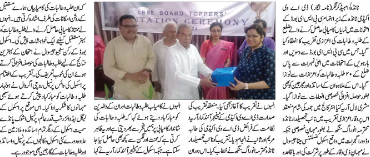
ڈی او ای اکیڈمی ٹائٹل کے زیر اہتمام شاندار اعزازی تقریب کا انعقاد۔

ضلع میں نمایاں کامیابی حاصل کرنے والے طلبہ و طالبات کو اعزازات سے نوازا گیا۔