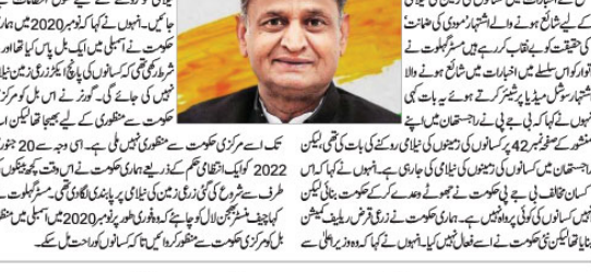
مودی کی ضمانت کی حقیقت کو بے نقاب کر رہے ہیں: گھلوٹ

کسانوں کی زمینوں کی نیلای کے لیے شائع کیے گئے اشتہار مودی کی ضمانت کی حقیقت کو بے نقاب کر رہے ہیں: گھلوٹ۔ کسانوں کی زمینوں کی نیلای کے لیے شائع کیے گئے اشتہار مودی کی ضمانت کی حقیقت کو بے نقاب کر رہے ہیں: گھلوٹ۔