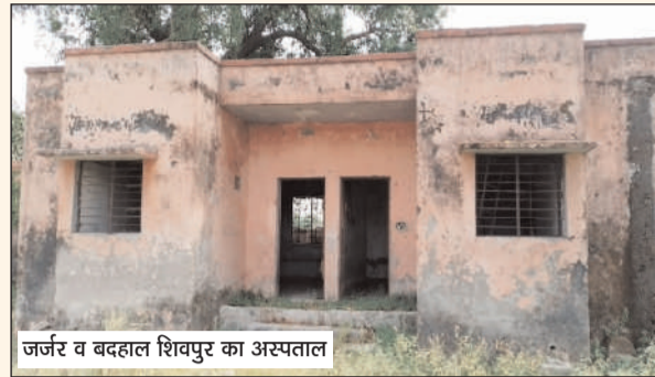
जर्जर व बदहाल शिवपुर का अस्पताल