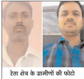
रैता क्षेत्र के ग्रामीणों की फोटो

के नेता आते हैं और मुंगेरीलाल का हसीन सपना दिखा कर चले जाते हैं। हम लोगों को अपने ब्लॉक मुख्यालय आने के लिए बिहार प्रदेश के रास्ते 45 किमी की दूरी तय करनी पड़ती है। मार्ग नहीं होने के कारण बरसात के दिनों 4 माह के लिए खड्डा से संपर्क टूट जाता है ऐसे में हमें भारी दुशारियों का सामना करना पड़ता है।