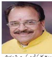
بھٹ نے قوم کی طاقت ثقافتی وراثت میں پنہاں ہے، بھٹ نے قوم کی طاقت ثقافتی وراثت میں پنہاں ہے۔

برائے وقت اسے بھٹ نے کہا ہے کہ ملی ملت کی ثقافت کو بچانے کی عہد داری ہے