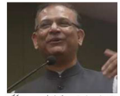
بھارتی (بی بی) بی بی نے ساتھیوں کی مدد سے ووٹوں کے حصول کے لیے اپنی پارٹی سے دوری اختیار کر لی ہے۔

ووٹ بھی نہیں دیا، انتخابی مہم میں حصہ بھی نہیں لیا اور پارٹی سے بھی دوری بنائی