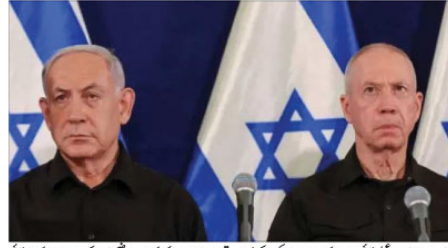
یہ تصویر 21 مئی (پنجشنبہ) کو اسرائیل کے پریس کنفرانس کے دوران فرانس کے وزیر اعظم جان کاسٹکس اور اسرائیلی وزیر اعظم بنیامین نتانیاہو کے درمیان ایک میڈیا کانفرنس کے دوران لیا گیا تھا۔

عالمی عدالت سے اسرائیلی وزیر اعظم کے خلاف وارنٹ گرفتاری کی استدعا پر امریکی صدر کا رد عمل