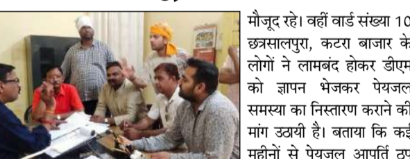
मौजूद रहे। वहीं वार्ड संख्या 10 छत्रसालपुरा, कटरा बाजार के लोगों ने लामबंद होकर डीएम को ज्ञापन भेजकर पेयजल समस्या का निस्तारण कराने की मांग उठायी है। बताया कि कई महीनों से पेयजल आपूर्ति ठप पड़ी है, जो कि चिन्ताजनक है। बताया कि मोहल्लेवासियों को स्वच्छ व सुरक्षित पानी की आवश्यकता है, जो कि उनके स्वास्थ्य को ठीक रखे।

से नगर क्षेत्र के मुहल्ला विष्णुपुर, कटरा बाजार, छत्रसालपुरा, चौबयाना, रावतयाना, मऊठाना, नेहरु नगर, गांधी नगर, सिविल लाइन सहित अन्य मोहल्लों में पेयजल की समस्या से मुहल्लेवासी जूझ रहे हैं जिसमें कुछ मुहल्लों में लाइन लीकेज होने के कारण पानी फैलता रहता है। उन्होंने डीएम से शीघ्र सर्वे करवाकर पेयजल समस्या का निदान