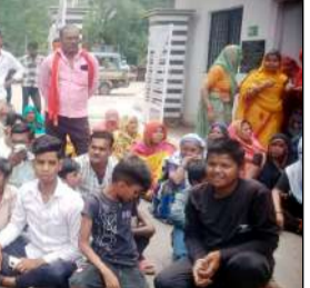
कलेक्ट्रेट में लोगों ने मटके फोड़कर जताया विरोध