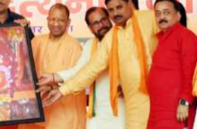
राहुल- अखिलेश की जोड़ी को बताया भस्मासुर, मुख्यमंत्री ने मेनका के जीत का अंतर बढ़ाने का किया आवाह

योगी आदित्यनाथ ने कहा कि अयोध्या में एयरपोर्ट का नाम महर्षि वाल्मीकि के नाम पर रखा गया है और वहां की रसोई शबरी के नाम पर चलती है उन्होंने बताया कि राम मंदिर के अंदर निराधार जगवान की स्थापना भी की जायेगी। योगी के संबोधन से पहले भाजपा प्रत्याशी मेनका गांधी ने लोगों को भारी मतदान करने का आवाह करते हुए इतनी भीषण गर्मी में भी इतनी संख्या में आने के लिए धन्यवाद दिया और उनका आभार प्रकट किया। साथ ही यह भी कहा कि जिस जनसैलाब के साथ आप लोग यहां पर एकत्रित हुए हैं इसी सैलाब के साथ