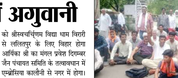
कलेक्ट्रेट में लोगों ने मटके फोड़कर जताया विरोध