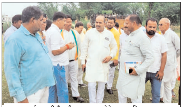
कार्यक्रम की तैयारी का जायजा लेते भाजपा जिलाध्यक्ष

कुशीनगर। भारतीय जनता पार्टी के राष्ट्रीय अध्यक्ष जेपी नड्डा और मुख्यमंत्री योगी आदित्यनाथ शुक्रवार को कुशीनगर आएंगे। भाजपा राष्ट्रीय अध्यक्ष और मुख्यमंत्री सुबह 10 बजे किसान इण्टर कालेज साखोपार में जनसभा को संबोधित करेंगे। इस दौरान राज्य सभा सांसद संगीता यादव और आरपीएन सिंह भी मौजूद रहेंगे। जिला मीडिया प्रभारी विश्वरंजन कुमार आनन्द ने बताया कि जिलाध्यक्ष दुर्गेश राय के नेतृत्व में जनसभा की सभी तैयारियां कर ली गई हैं। गुरुवार को जिलाध्यक्ष दुर्गेश राय और स्थानीय विधायक पीपून् पाठक जनसभा स्थल निरीक्षण किया और पदाधिकारियों के साथ बैठक कर की तैयारियों को अंतिम रूप दिया। इस अवसर पर जिला उपाध्यक्ष व