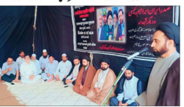
صدر ایران کو امر و باہیں پیش کی گئی تعزیرت۔