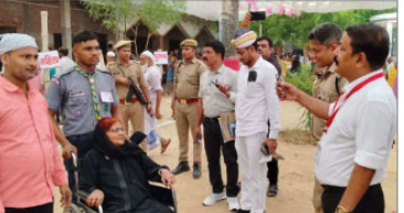
امبیڈکر نگر لوک سبھا میں سب سے زیادہ ووٹنگ۔

پہارنگ ڈی ایم اور ایمنہ کی ترقی کے لیے قانون سازی کے لیے ایک کمیٹی کی تشکیل کی گئی ہے۔ اس کمیٹی کے سربراہ کی حیثیت سے جج جے ایم علی نے سرکاری طور پر شہرہ آفاق سٹیٹ بار کونسل کے سربراہ کی حیثیت سے خدمات انجام دی ہیں۔ جج علی نے اس موقع پر ایک پریس کانفرنس منعقد کی، جس کے دوران انہوں نے ڈی ایم کے تحت قانون سازی کے لیے ایک کمیٹی کی تشکیل کی گئی ہے۔