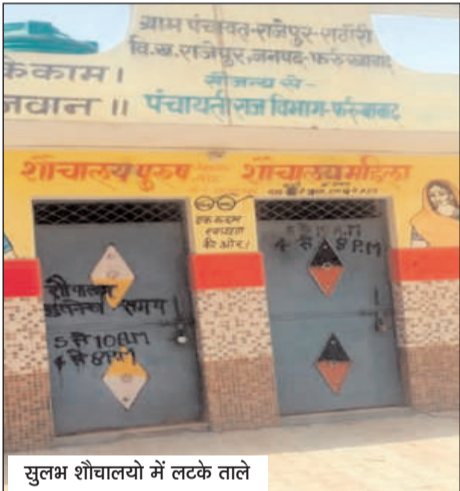
सुलभ शौचालयों में लटके ताले

इन शौचालयों के निर्माण का उद्देश्य गरीब जनता को सुविधा मुहैया कराना है। परंतु जब इन सामुदायिक शौचालय में ग्राम समाज के मुखिया ताला लगाकर बैठ जाते हैं तो इससे साफ जाहिर होता है कि उन्होंने इनका महत्व या तो समझा ही नहीं या फिर इन्हें अपनी निजी संपत्ति समझ लिया। इन शौचालयों का बड़ा उद्देश्य होता है। जिस गरीब के घर में शौचालय ना हो वह यहां जा सकता है आने जाने वाले