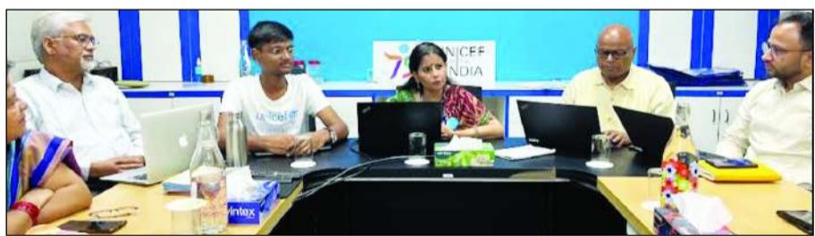
5 जून को मनाए जाने वाले विश्व पर्यावरण दिवस और मिशन लाइफ के अंतर्गत यूनिसेफ द्वारा आयोजित संगोष्ठी में जलवायु परिवर्तन से लड़ने के लिए सोसाइटी में युवाओं को जोड़ कर करेंगे जागरूकता