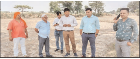
सुमही खुर्द में भूमि का निरीक्षण करते बिजली विभाग के अधिकारी

अधिक दूरी तथा अधिक लोड होने के चलते आए दिन फाल्ट तथा लो वोल्टेज की समस्या से लोग परेशान होते रहते हैं। इसके निवारण के लिए पूर्व विधायक ने शासन स्तर पर प्रयास करने के बाद विकास खण्ड के उक्त गांव में बिजली उपकेंद्र स्वीकृत कराया था लेकिन काफी समय बीत