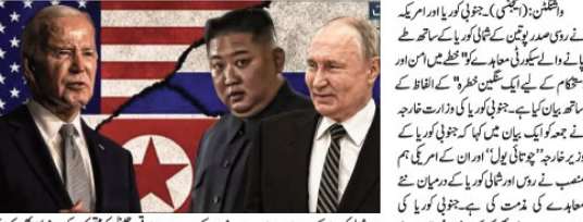
واشنگٹن (بجٹوی)۔ جنوبی کوریا اور امریکہ نے روس کے ساتھ معاہدے سے پریشانی کا اعلان کیا ہے۔

واشنگٹن (بجٹوی)۔ جنوبی کوریا اور امریکہ نے روس کے ساتھ معاہدے سے پریشانی کا اعلان کیا ہے۔ جنوبی کوریا اور امریکہ نے روس کے ساتھ معاہدے سے پریشانی کا اعلان کیا ہے۔