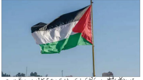
آرمینیا (بجٹوی) فلسطینی ریاست کو تسلیم کرنے کے لیے اعلان کر رہا ہے۔ اس اقدام کا اعلان نے فلسطینیوں کو بہت خوش کیا۔