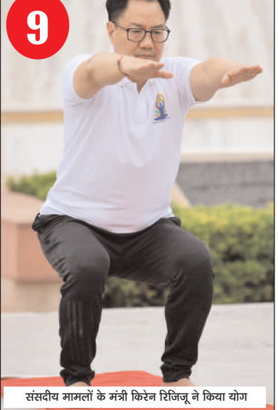
संसदीय मामलों के मंत्री किरेन रिजिजू ने किया योग