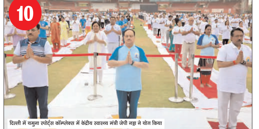
दिल्ली में यमुना स्पोर्ट्स कॉम्प्लेक्स में केंद्रीय स्वास्थ्य मंत्री जेपी नड्डा ने योग किया