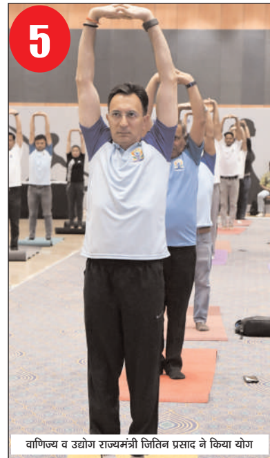
वाणिज्य व उद्योग राज्यमंत्री जितेंद्र प्रसाद ने किया योग

भगवा टीशर्ट में नजर आए सीएम योगी, अनुलोम-विलोम सहित किए प्राणायाम लखनऊ। अंतरराष्ट्रीय योग दिवस के अवसर पर मुख्यमंत्री योगी आदित्यनाथ ने लखनऊ के राजभवन में आयोजित योग कार्यक्रम में हिस्सा लिया और योगासन किए। इस दौरान वो हर रोज से अलग भगवा टीशर्ट में नजर आए। उन्होंने अनुलोम-विलोम सहित कई प्राणायाम किए और लोगों से नियमित अभ्यास करने की अपील की। उन्होंने कहा कि योग एक संपूर्ण विद्या है, जो हमें शारीरिक और मानसिक रूप से एकजुट करता है।