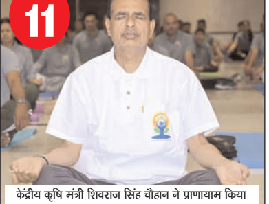
केंद्रीय कृषि मंत्री शिवराज सिंह चौहान ने प्राणायाम किया