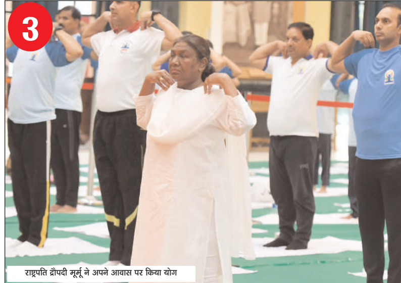
राष्ट्रपति द्रौपदी मुर्मू ने अपने आवास पर किया योग

योग की शक्ति को मानती है। विश्व योग को वैश्विक भलाई के लिए एक शक्तिशाली एजेंट के रूप में देखता है। यह लोगों को अतीत के बोझ को छोड़ बिना वर्तमान में जीने में मदद करता है। पीएम मोदी ने कहा कि इसी साल भारत में फ्रांस की 101 साल की महिला योग टीचर को पद्मश्री अवार्ड दिया गया है। वह कभी भारत नहीं आईं, लेकिन उन्होंने योग प्रचार के लिए अपना पूरा जीवन समर्पित कर दिया है। पीएम मोदी ने कहा कि 2014 में मैंने यूपीए में अंतरराष्ट्रीय योग दिवस का प्रस्ताव रखा था। भारत के इस प्रस्ताव का 177 देशों ने समर्थन किया था और ये अपने आप में एक रिकॉर्ड है, जब से योग दिवस लगातार नए रिकॉर्ड बनाता जा रहा है। दुनिया में योग पर रिसर्च हो रही है। दुनिया के नेता अब योग पर बात करते हैं। योग से समाज में बदलाव आ रहा है। प्रधानमंत्री मोदी ने कहा कि दुनिया में योग करने वालों की संख्या बढ़ रही है। दुनिया के कई देशों में योग दिनचर्या का हिस्सा बन रहा है। सऊदी में योग एजुकेशन सिस्टम में शामिल है कश्मीर की धरती से पीएम मोदी ने 10वें अंतरराष्ट्रीय योग दिवस की सभी को बधाई दी। उन्होंने कहा कि जम्मू-कश्मीर योग साधना की भूमि है। योग की यात्रा अनवरत जारी है। ऋषिकेश और काशी से लेकर केरल तक हम देश में योग को पर्यटन के नए ट्रेड को उभरते हुए देख सकते हैं। योग सीखने के लिए दुनिया भर से लोग भारत आ रहे हैं। साथ ही कहा कि पिछले वर्ष मुझे संयुक्त राष्ट्र मुख्यालय, यूपीएस में योग