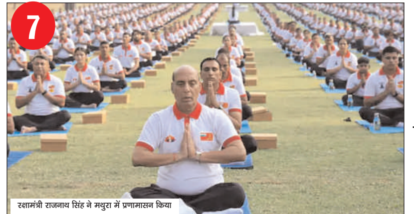
रक्षामंत्री राजनाथ सिंह ने मथुरा में प्रणामासन किया