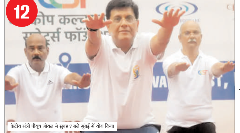
केंद्रीय मंत्री पीयूष गोयल ने सुबह 7 बजे सुबह 7 में योग किया