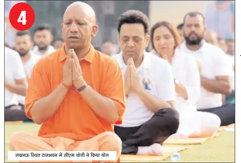
लखनऊ स्थित राजभवन में सीएम योगी ने किया योग

एकाग्रता मानव मन की सबसे बड़ी ताकत है: पीएम पीएम मोदी ने कश्मीर की धरती से दुनिया भर के लोगों को अंतरराष्ट्रीय योग दिवस की बधाई दी। उन्होंने कहा कि दस साल पहले, मैंने संयुक्त राष्ट्र में अंतरराष्ट्रीय योग दिवस मनाने का प्रस्ताव रखा था। भारत के प्रस्ताव को 177 देशों ने समर्थन दिया, जो अपने आप में एक रिकॉर्ड है। प्रधानमंत्री मोदी ने कहा कि आज पूरी दुनिया में योग करने वालों की संख्या निरंतर बढ़ रही है, योग के प्रति आकर्षण बढ़ रहा है। इसी साल भारत में फ्रांस की