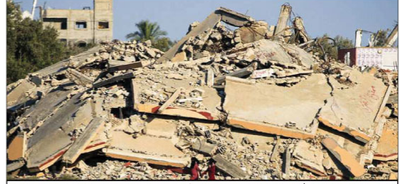
غزہ جنگ جیتا طویل ہو گیا، مغربی کنارے میں جو کچھ وہاں خطرناک ہے: یورپی یونین

اسرائیلی فوج صحافیوں کو نارگت بنا کر ہلاک کرتی ہے، بین الاقوامی ادارے کی تحقیقاتی رپورٹ