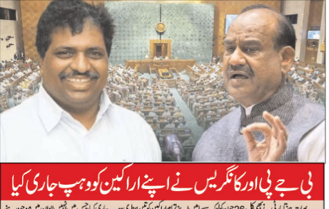
بی جے پی اور کانگریس نے اپنے اپنے امیدواروں کو لوک سبھا اسپیکر اور ڈپٹی اسپیکر کے عہدوں کے لیے پیش کیا ہے۔

ڈپٹی اسپیکر کے عہدہ کیلئے حزب مخالف نے کیا مطالبہ، بی جے پی کے ام برہلا اور کانگریس کے سریش نے لوک سبھا اسپیکر کے لیے پرچنا مزدگی داخل کیا