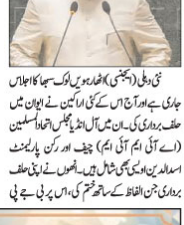
او ایس نے حلف برداری کے بعد جے ایم، جے ایم، جے فلسطین، کالگا یاغره بی جے پی اراکین پارلیمنٹ ناراض۔

فلسطین، کالگا یاغره بی جے پی اراکین پارلیمنٹ ناراض۔ او ایس نے حلف برداری کے بعد جے ایم، جے ایم، جے فلسطین، کالگا یاغره بی جے پی اراکین پارلیمنٹ ناراض۔