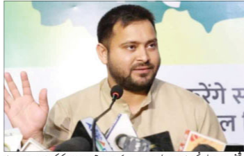
بی بی آئی کیسوں میں ایک کیس 'ایس پی آئی کیس' ہے، جس کی جانچ چارجز، آر جی اے اور ایچ ڈی ایس کے ساتھ کی گئی ہے۔

بہار میں جرائم کے حوالے سے تیسویں کاپی ایم مودی پر سخت حملہ کیا گیا ہے۔ بی بی آئی کیسوں میں ایک کیس 'ایس پی آئی کیس' ہے، جس کی جانچ چارجز، آر جی اے اور ایچ ڈی ایس کے ساتھ کی گئی ہے۔ بی بی آئی کیسوں میں ایک کیس 'ایس پی آئی کیس' ہے، جس کی جانچ چارجز، آر جی اے اور ایچ ڈی ایس کے ساتھ کی گئی ہے۔