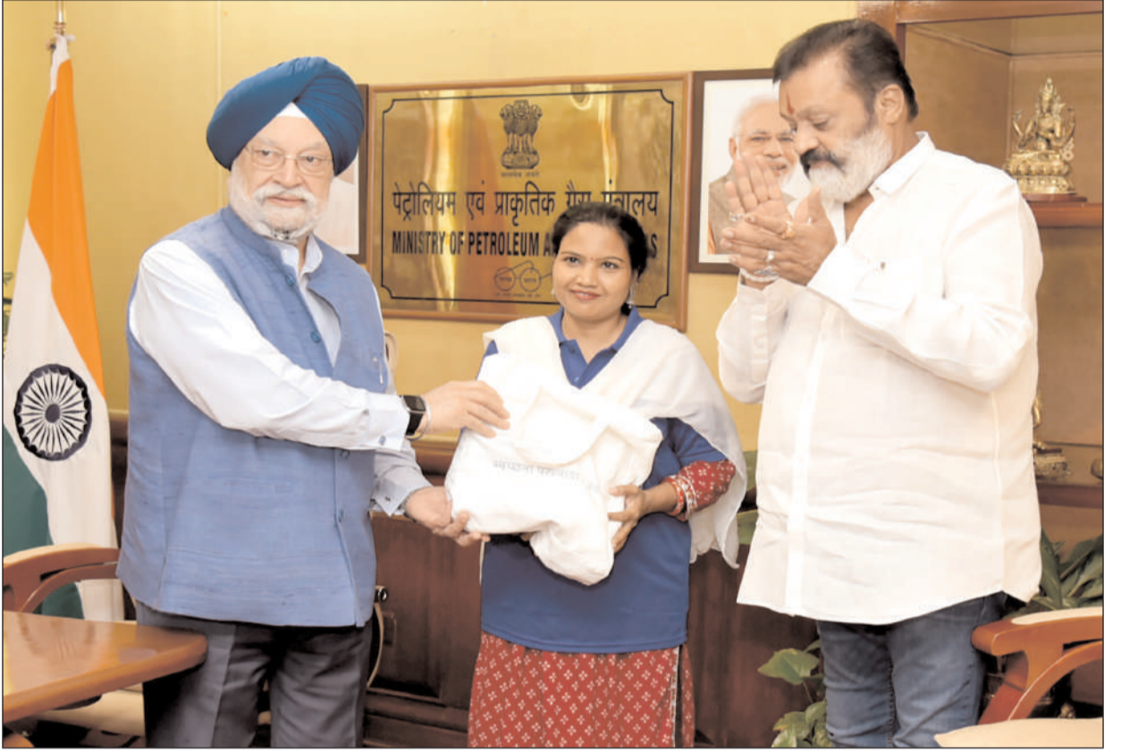
नई दिल्ली में स्वच्छता पखवाड़ा 2024 के उद्घाटन पर केंद्रीय पेट्रोलियम और प्राकृतिक गैस मंत्री, श्री हरदीप सिंह पुटी और पेट्रोलियम और प्राकृतिक गैस और पर्यटन राज्य मंत्री, श्री सुरेश गोपी।

लखनऊ। प्रदेश के पिछड़ वर्ग कल्याण एवं दिव्यांगजन सर्जािकरण राज्य मंत्री (स्वतंत्र प्रभार) नरेन्द्र कश्यप ने सोमवार को डॉ. शकुन्तला मिश्रा, राष्ट्रीय पुनर्वास विध्वविद्यालय, मोहान रोड, लखनऊ का निरीक्षण किया। इस दौरान उन्होंने विध्वविद्यालय के छात्र-छात्राओं से उनकी समस्याओं के संबंध में वार्ता की तथा कुलपति एवं रजिस्ट्रार सहित विध्वविद्यालय के अधिकारियों के साथ बैठक की। मंत्री कश्यप ने निर्देश दिए कि प्रदेश सरकार की योजनाओं का लाभ अधिक से अधिक दिव्यांगजन छात्र-छात्राओं को मिले। उन्होंने विध्वविद्यालय में कौशल विकास के नए कोर्स शुरू करने के निर्देश दिए और कहा कि इन कोर्सों के माध्यम से दिव्यांगजन छात्र-छात्राओं को हुनरमंद बनाने का कार्य किया जाए। उन्होंने विध्वविद्यालय में रिक्त पदों को भरने की प्रक्रिया को शीघ्र पूरा करने का भी निर्देश दिया ताकि छात्रों को बेहतर शिक्षा प्राप्त हो सके। मंत्री कश्यप ने छात्रावासों में सफाई का विशेष ध्यान रखने के निर्देश दिए और कहा कि दिव्यांगजन छात्रों को किसी भी प्रकार की परेशानी का सामना न करना पड़े।