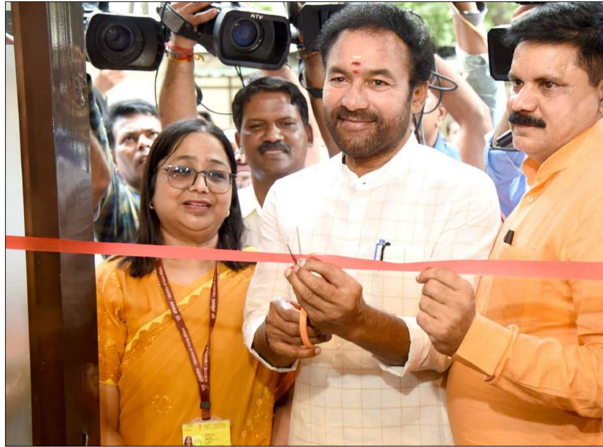
केन्द्रीय कोयला और खान मंत्री, श्री जी. किशन रेड्डी ने नई दिल्ली के शास्त्री भवन में जिला खनिज फाउंडेशन (डीएमएफ) गैलरी का उद्घाटन किया।

बहराइच। विकास खण्ड नवाबगंज अन्तर्गत ग्राम चर्दा में जल जीवन मिशन "हर घर जल कार्यक्रम" के तहत ग्राम चर्दा में रु. 439.71 लाख की लागत से निर्माणधीन चर्दा पाइप पेयजल परियोजना का स्थलीय निरीक्षण किया। पेयजल परियोजना के निरीक्षण के दौरान विभागीय अधिकारियों द्वारा बताया गया कि परियोजना के तहत प्रस्तावित 01 अदद ट्यूबवेल, पम्पिंग एवं क्लोरीनेटिंग प्लांट, 37 किलोवाट का सोलर प्लांट, 400 किलो लीटर क्षमता की 14 मी. स्टैंडिंग का आर.सी.सी. शिरोमणि जलाशय, 40 मी. राईजिंग मेन 150 एमएम, 14.121 कि.मी. वितरण प्रणाली, 01 अदद पम्प हाउस एवं क्लोरीनेटिंग रूम व बाउण्ड्री वाल व गेट का निर्माण कार्य प्रस्तावित है। पाईप पेयजल परियोजना के तहत लक्ष्य 1204 अदद के सापेक्ष अब तक 448 हाउस कनेक्शन निर्गत किये गये हैं। डीएम ने निर्देश दिया कि पाइप लाइन बिछाने के कारण क्षतिग्रस्त परिसम्पत्तियों का निर्माण अच्छे ढंग से किया जाय