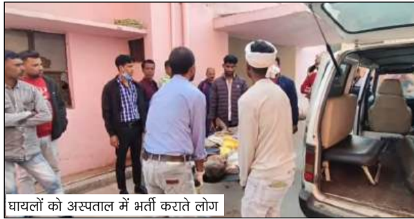
घायलों को अस्पताल में भर्ती कराते लोग

पकवाइनार फोरलेन पर हुआ यह हादसा एक इंसानियत की बेमिसाल कहानी का हिस्सा बन गया। बताया जा रहा है कि तमकुहीराज से गोरखपुर जा रहा एक ट्रेलर चालक ने सड़क पार कर रहे एक बुजुर्ग को बचाने के लिए अनायास ही गाड़ी का चक्का डिवाइडर की ओर मोड़ दिया। आश्चर्यजनक यह है कि इसी कोशिश के दौरान ट्रेलर डिवाइडर पार कर दूसरी लेन में पहुंच गया,