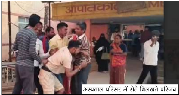
अस्पताल परिसर में रोंते बिलखते परिजन

जहां दूसरी तेज रफतार ट्रेलर से दुर्घटना ने सड़क से लेकर अस्पताल तक हर किसी का मन दुखी कर दिया। परिवारों की चीखें और घायलों की तड़प कौड़ी-सी