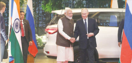
روسی صدر ولادیمیر پوتن نے ہندوستان کے لیے دو روزہ دورے پر ہندوستان کی سرگرمیوں سے بھٹ سے پیچھے ہٹنے سے انہوں نے اپنی جگہ برقرار رکھی ہے۔