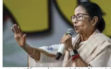
کانگریس لیڈر کا زبردست احتجاج...