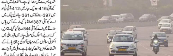
دہلی میں شدید آلودگی، اسموگ اور کھربے کی وجہ سے اکھڑنے لگی سانسیں...