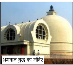
भगवान बुद्ध का मंदिर

बुद्ध नगरी में हर वर्ष लगता है मेला, वषों-वषों पर तैनात रहेगी फोर्ट