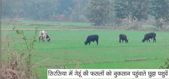
सिरिसिया में गेहूं की फसलों को बुकसान पहुंचाते छुट्टा पशुएं

मथौली, कुशीनगर। कस्बे में गौ आश्रय स्थल न होने से नगर में आकारा व छुट्टा पशुओं की भरमार सी हो गई है। पशुओं का झुंड किसानों की खेड़ी फसलों को बड़े पैमाने पर नुकसान पहुंचा रहे है लेकिन नगर प्रशासन इस पर ध्यान नहीं दे रहा जिससे किसानों में भारी आक्रोश व्याप्त है। बता दें कि नगर पंचायत मथौली गटन के करीब साढ़े तीन वर्ष हो है। ऐसे में यहां विकास की गंगा बह रही है, लेकिन इतने वर्षों में नगर के जिम्मेदारों द्वारा एक गौ आश्रय स्थल नहीं बनवाया गया जबकि जिले के समस्त नगर पंचायतों में आश्रय स्थल बनवाकर पशुओं को सुरक्षित रखा गया है लेकिन मथौली नगर अब तक आश्रय स्थल नहीं बनवाया गया है। बता दें कि छह