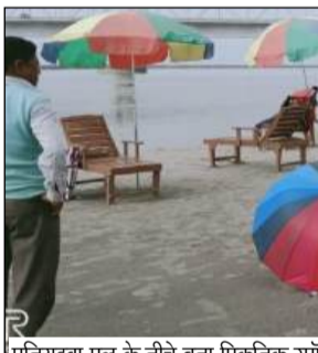
पनियहवा पुल के नीचे बना पिकनिक स्पॉट

कुशीनगर (अवधानामा ब्यूरो)। नव वर्ष पर आज कुशीनगर में आने वाले बुद्ध को मुख्य मंदिर में भगवान बुद्ध की छद्म शताब्दी की प्रतिमा का दर्शन करने में किसी प्रकार की कोई असुविधा न हो इसके लिए जिला प्रशासन ने पूरी तरह से सुनिश्चित है। रामा भार स्तूप और माथा कुंजर मंदिर परिसर भी खुला रहेगा। मुख्य मंदिर के बगल में स्थित बर्मी मंदिर में भी श्रद्धालु दर्शन-पूजन कर सकेंगे। पूरे मेला क्षेत्र की सुरक्षा के लिए पुलिस फोर्स तैनात रहेगी। मंदिर क्षेत्र में भीड़ को नियंत्रित करने के