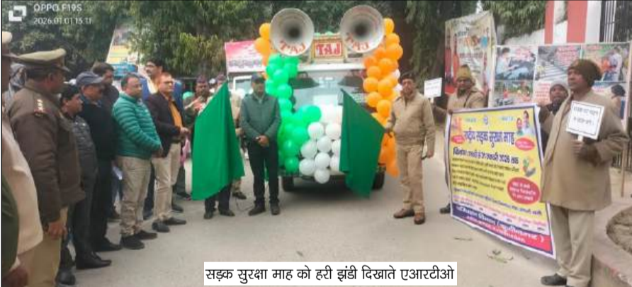
सड़क सुरक्षा माह को हरी झंडी दिखाते एआरटीओ