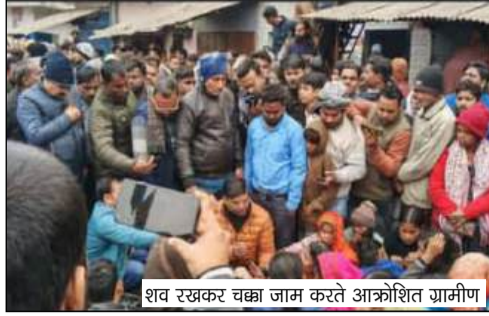
शव रखकर चक्का जाम करते आक्रोशित ग्रामीण