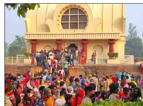
नए वर्ष पर भगवान बुद्ध की दर्शन को उमड़े लोग, पनियहवा पुल के नीचे नौका विहार का आनंद लेते और बुद्ध स्थलीय पर लगा मेले का दृश्य

कुशीनगर। नववर्ष के जश्न में गुरुवार को सभी लोग सराबोर नजर आए। बुधवार की मध्य रात्रि से ही आतिशबाजी और गीत-संगीत का जो कार्यक्रम शुरू हुआ, वह नए वर्ष के दिन भी जारी रहा। सुबह कुशीनगर के बौद्ध मंदिर, रामा भार स्तूप, मुख्य मंदिर सहित अन्य दर्शनीय स्थलों पर भ्रमण के अलावा लोगों ने मदनपुर देवी मंदिर में पूजा-अर्चना से नववर्ष की शुरुआत की। रामकोला का विश्वदर्शन मंदिर और पनियहवा पुल की पिकनिक स्पॉट के रूप नजर आया। वहां काफी संख्या में लोगों ने मेले का लुफ्त उठाया। हर वर्ष की भांति भगवान बुद्ध की महारिनिर्वाण स्थली कुशीनगर में कड़ी सुरक्षा व्यवस्था के बीच नववर्ष मेला संपन्न हो गया। सुबह से देर शाम