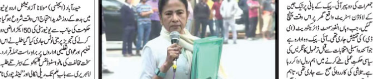
پریکٹس جین کے گھری آڈی کے چھاپے کے دوران ہتھیار متاثرہ۔

پریکٹس جین کے گھری آڈی کے چھاپے کے دوران ہتھیار متاثرہ۔ پولیس نے ہتھیاروں کی تلاش کی۔