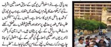
مولانا آزاد نیشنل اردو یونیورسٹی کی زمین پر سرکاری کاروبار کا احتجاج۔

دیلتی ہائی کورٹ کے عدالت کے سامنے لوگوں کی لمبی لائنیں نظر آ رہی ہیں۔ ان لوگوں نے عدالت سے اپنا حق مانگنے کے لیے درخواستیں دائر کی ہیں۔ ان میں سے کئی لوگوں نے کہا کہ انھیں عدالت سے انصاف ملنے کی ضرورت ہے۔