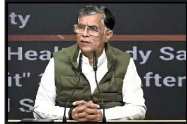
یو۔ پی۔ (جسٹی) کانگریس کے سینئر رہنما یون کھیڑا نے اندور کے مہاجر گھرنے ہوائی علاقے میں آلودہ پانی سے متاثرہ لوگوں کو دکھایا۔

یون کھیڑا نے اندور میں آلودہ پانی سے 18 اموات پر بی جے پی حکومت کو نشانہ بنایا، سوچو بھارت اور ہر گھر جل اسکیم کو ناکام قرار دیا اور شفاف جانچ کا مطالبہ کیا