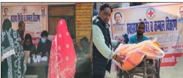
■ इंडियन रेड क्रॉस सोसाइटी के तत्वावधान में स्वास्थ्य शिविर एवं कंबल वितरण का आयोजन हुआ