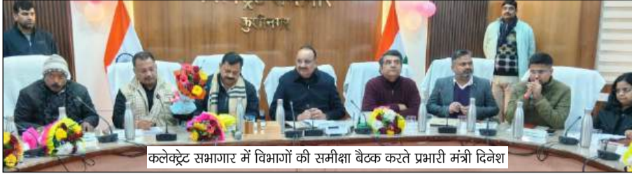
क्लेक्ट्रेट सभागार में विभागों की समीक्षा बैठक करते प्रभारी मंत्री दिनेश

कुशीनगर। क्लेक्ट्रेट सभागार में प्रभारी मंत्री दिनेश प्रताप सिंह की अध्यक्षता में विकास कार्यों और कानून व्यवस्था की समीक्षा हुई। बैठक में लापरवाही पर कड़ा रुख अपनाते हुए मंत्री ने तत्त्व लहजे में कहा -अब फाइलों में नहीं, जमीन पर दिखेगा काम। पीएमजीएसवाई व प्रधानमंत्री सड़क योजना की सड़कों पर संतोषजनक जवाब मिलने पर मंत्री ने अधिकारियों को फटकार लगाई और सभी सड़कों की सूची जनप्रतिनिधियों की सहमति से तैयार कर मरम्मत प्रस्ताव तालुक भेजने के निर्देश दिए।