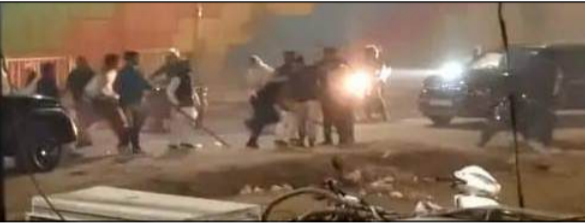
मथुरा में गुंडई चरम पर, पहलवानों के दो गुटों में जमकर भिड़ंत, आधे घंटे तक चला टांडव

मथुरा। जलपट में कानून-व्यवस्था पर एक बार फिर सवाल खड़े हो गए हैं। मंडी चौराहा के समीप पंचवाही रोडोई रेस्टोरेण्ट के सामने पहलवानों के दो गुटों के बीच हुई जबरदस्त भिड़ंत ने इलाके में दहशत फैला दी। कसब आधे घंटे तक चलने लगे हंगामे में दोनों पक्षों के बीच जमकर मारपीट हुई, लाठी-खड़े चले और कई वाहनों में तोड़फोड़ की गई। घटना का वीडियो सोशल मीडिया पर तेजी से वायरल हो रहा है, जिसमें साफ देखा जा सकता है कि खुलेआम सड़क पर एक-दूसरे पर हमला किया जा रहा है। बीच सड़क पर हो रही मारपीट के चलते अफरा-तफरी मच गई और राहगीरों व स्थानीय लोगों में भय का माहौल बन गया जबकि यहां हर समय पुलिस मौजूद रहती है। प्रत्यक्षदर्शियों के अनुसार विवाद अचानक शुरू हुआ और देखते ही देखते उस रूप ले लिया। हंगामे की सूचना मिलते ही पुलिस मौके की ओर रवाना हुई लेकिन पुलिस वाहन को आता देख दोनों पक्षों के लोग मौके से फरार हो गए। घटना के बाद क्षेत्र में तनाव का माहौल बना हुआ है। पुलिस वायरल वीडियो के आधार पर आरोपियों की पहचान करने में जुटी है।