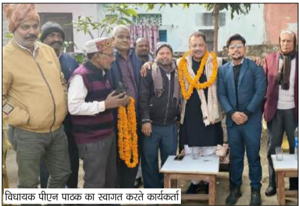
विधायक पी.एन पाठक का स्वागत करते कार्यकर्ता

आत्मनिर्भर बनाया जाए। भाजपा सरकार की ओर से आमजन के लिए विभिन्न जनकल्याणकारी योजना चलाकर सभी वर्गों के लोगों को लाभान्वित किया जा रहा है।