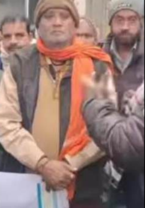
स्थानीय थाने में जाने की सूचना देने को कहा।