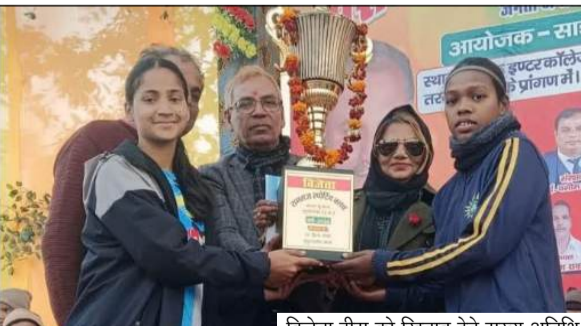
विजेता टीम को खिताब देते मुख्य अतिथि

तमकुहीराज, कुशीनगर। रामराज ऑल इंडिया फुटबॉल प्रतियोगिता तक्रारसुजान के अंतर्गत आयोजित वन-डे महिला फाइनल मैच में महिला एकेडमी फुटबॉल क्लब रांची (बिहार) और एमपीआरसी क्लब देवरिया (उत्तर प्रदेश) के बीच रोमांचक मुकाबला खेला गया। कड़े संघर्ष से भरपूर इस फाइनल में रांची की टीम ने शानदार प्रदर्शन करते हुए 2-1 से जीत दर्ज कर खिताब अपने नाम किया।