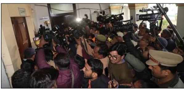
■ तोड़फोड़ पर नहीं लिखी एफआईआर