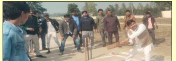
मसौली बाराबंकी। (अवधनामा संवाददाता)