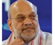
تہمت 3/ راجہ بھنگی پینک (25) نمبر (10) کھنڈ، 13 جنوری 2026ء مطابق 24- رجب المرجب - 1443ھ - 8 صفحات

حکومت بنانے کے لیے بائیں بازو اور کانگریس میچ فکسنگ کرتے ہیں: امت شاہ حکومت بنانے کے لیے بائیں بازو اور کانگریس میچ فکسنگ کرتے ہیں: امت شاہ حکومت بنانے کے لیے بائیں بازو اور کانگریس میچ فکسنگ کرتے ہیں: امت شاہ