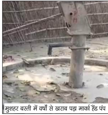
मुशहर बस्ती में वर्षों से खराब पड़ मार्का हैंड पंप