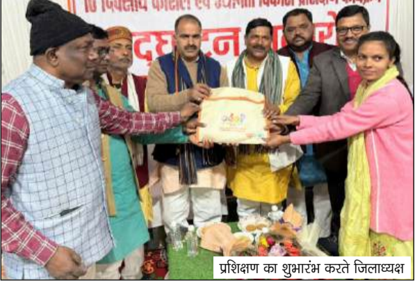
प्रशिक्षण का शुभारंभ करते जिलाध्यक्ष

लाभ उठाने और सफल उद्यमी बनने की शुभकामनाएं दीं। कार्यक्रम के दौरान विधायक द्वारा 10 लाभाभियों को स्टडी किट का वितरण भी किया गया। जिला उद्योग प्रोत्साहन एवं उद्यमिता विकास केंद्र द्वारा प्रायोजित यह प्रशिक्षण कार्यक्रम विगत वर्षों की भांति इस वर्ष भी आयोजित किया जा रहा है। योजना के अंतर्गत जनपद कुशीनगर में केले के उत्पाद से जुड़े 350 लाभाभियों को प्रशिक्षण प्रदान किया जाएगा। इस प्रशिक्षण कार्यक्रम का संचालन यू पी. इंस्टीट्यूट फॉर स्ट्रेटेजिक