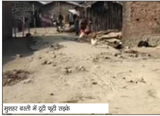
मुशहर बस्ती में टूटी फूटी सड़कें