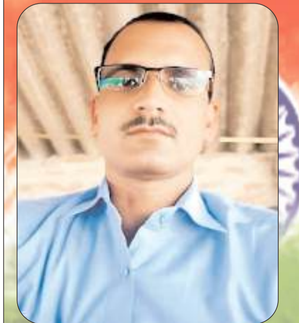
जगदम्बा मौर्या प्रधान ग्राम सभा चिलबिला खतीपुर विकास खण्ड पंडरी कृपाल जनपद गोण्डा

समस्त क्षेत्रवासियों एवं जनपदवासियों को गणतंत्र दिवस की हार्दिक शुभकामनाएं