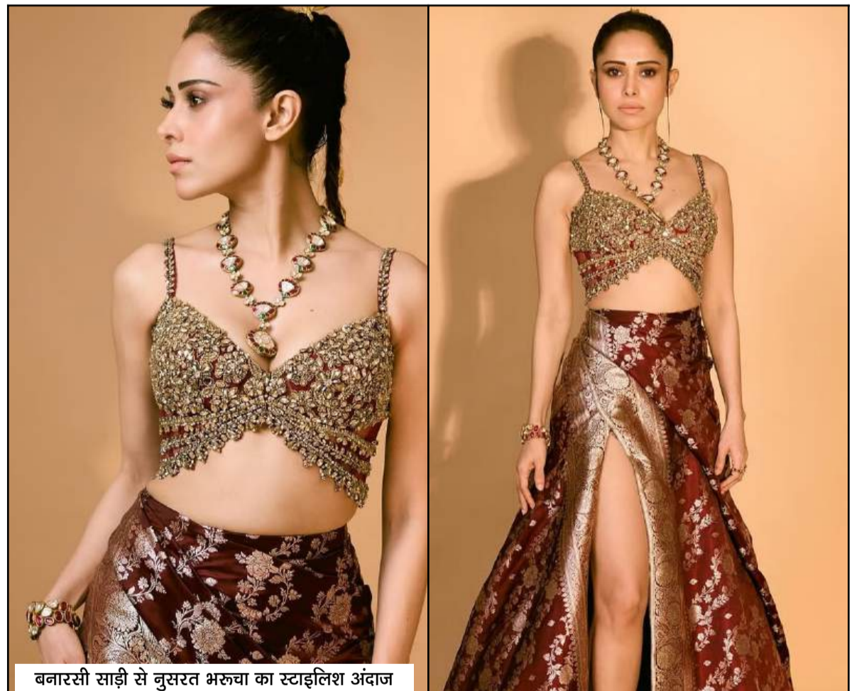
बनारसी साड़ी से नुसरत भरुचा का स्टाइलिश अंदाज

नहीं। उनसे जब पूछा गया कि क्या उनकी वजह से गोविंदा को कभी असुरक्षित फील हुआ? इस पर एक्टर ने कहा, गोविंदा सेट पर सभी से असुरक्षित थे। आदि ने आगे कहा, उन्हें यकीन नहीं था कि मैं फिल्म में टाइगर तड़पार की भूमिका निभा सकता हूँ और उन्होंने मेरे साथ दो अन्य खलनायकों को जोड़ने का सुझाव दिया।