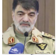
اسلامی جمہوریہ ایران کے پلین چیف احمد رضا

تہران (ایوان آئی) دفاعی کوششوں نے ملک کے خلاف دہائیوں سے جاری ہو رہی ہے۔ ایران کی دفاعی کوششوں نے ہر دشمنانہ اقدام کا محکم جواب دیا جائے گا۔ ایران پولیس چیف کا دشمن کو انتباہ، غلطی کی صورت میں پچھتاؤ گے۔ اسلامی جمہوریہ ایران کے پلین چیف احمد رضا نے کہا ہے کہ ایران کی دفاعی کوششوں نے ہر دشمنانہ اقدام کا محکم جواب دیا جائے گا۔ ایران پولیس چیف کا دشمن کو انتباہ، غلطی کی صورت میں پچھتاؤ گے۔ ایران کے پلین چیف احمد رضا نے کہا ہے کہ ایران کی دفاعی کوششوں نے ہر دشمنانہ اقدام کا محکم جواب دیا جائے گا۔ ایران پولیس چیف کا دشمن کو انتباہ، غلطی کی صورت میں پچھتاؤ گے۔