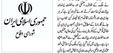
جمہوری اسلامی ایران شوری دفاع

ایران پولیس چیف کا دشمن کو انتباہ، غلطی کی صورت میں پچھتاؤ گے!