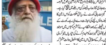
آشرم کے مالک اور گجرات ہائی کورٹ کے جج

آشرم سمیت 30 ناجائز تعمیرات پر چلے گا سرکاری بلڈوزر