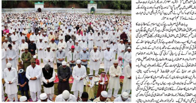
ایک بڑے اجتماع میں شرعی امور کی تعلیم دینے والے علماء کرام کی ایک جماعت۔

آیت سے بیکار ہوتا ہے۔ اور جو بیکار ہو جائے گا، اللہ تعالیٰ نے اسے کھانا پکانے اور کھانے کا انتظام کرنے کے لیے حکم دیا ہے۔ اللہ تعالیٰ نے انسان کو کھانا پکانے اور کھانے کا انتظام کرنے کے لیے حکم دیا ہے۔ اللہ تعالیٰ نے انسان کو کھانا پکانے اور کھانے کا انتظام کرنے کے لیے حکم دیا ہے۔