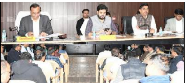
○ हाई स्कूल तथा इंटरमीडिएट परीक्षाओं के संबंध में विकास भवन स्थित प्रेरणा सभागार में बैठक