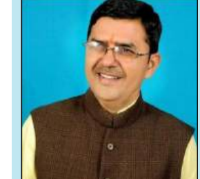
लखीमपुर खीरी।