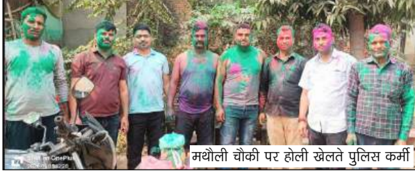
मधोली चौकी पर होली खेलते पुलिस कर्मी

बता दें कि हर वर्ष की भांति इस बार होली त्योहार कड़े सुरक्षा व्यवस्था के बीच संपन्न हुई। रंगों से सराबोर हुए बच्चे, नौजवान व बुजुर्ग सभी टोली बनाकर होली खेलते नजर आए। एक दूसरे को रंग व गुलाल लगाकर होली की मुबारकबाद देते दिखे। खासकर