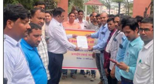
ग्राम स्तर पर कर रहे हैं। लंबे समय से मानदेय न मिलने के कारण ग्राम रोजगार सेवकों को आर्थिक स्थिति गंभीर हो गई है और परिवार का भरण-पोषण करना भी कठिन हो रहा है। संच ने चार प्रमुख मांगें रखीं—पहली, आठ माह का बकाया मानदेय जल्द भुगतान किया जाए। दूसरी, कार्यभार और महंगाई को देखते हुए मानदेय बढ़ाकर 35 हजार रुपये प्रतिमाह किया जाए। तीसरी, समय पर भुगतान सुनिश्चित

करने के लिए अलग से वित्तीय बजट की व्यवस्था की जाए।