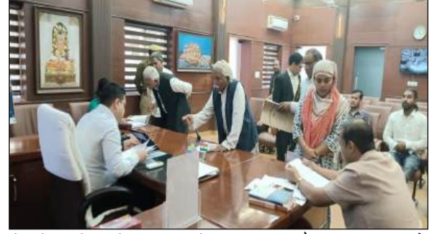
से जुड़े मामले सामने आए। डीएम ने अधिकारियों को निर्देशित किया कि निस्तारण की जानकारी समय से प्रत्येक प्रकरण की साप्ताहिक समीक्षा उपलब्ध कराई जाए।

उन्होंने कहा कि सभी विभाग यह सुनिश्चित करें कि जनता की समस्याओं का त्वरित एवं गुणवत्तापूर्ण समाधान किया जाए और शिकायतों के निस्तारण में किसी प्रकार की लापरवाही न बरती जाए। जनता दर्शन में मुख्य रूप से भूमि विवाद, राजस्व संबंधी प्रकरण, पेंशन, विद्युत, जलापूर्ति, सड़क मरम्मत, स्वास्थ्य सुविधाएं तथा विभिन्न जनकल्याणकारी योजनाओं