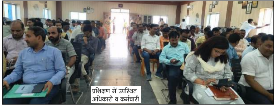
प्रशिक्षण में उपस्थित अधिकारी व कर्मचारी