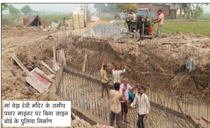
मां चेंड़ा देवी मंदिर के समीप पधार माइजर पर बिना साइन बोर्ड के पुलिसिया निर्माण

कुशीनगर (अवधानामा ब्यूरो)। जिले के मोतीचक क्षेत्र व नगर पंचायत मथौली में लोक निर्माण विभाग (पीडब्ल्यूडी) की कार्यशैली पर गंभीर सवाल खड़े हो रहे हैं। यहां नगर पंचायत के वार्ड नंबर 16 लोहेपार में करोड़ों रुपये (स्थानीय सूत्रों के अनुसार लाखों रुपये) की लागत से बन रही पिच सड़क का निर्माण पूरी तरह से नियमों की धज्जियां उड़ते हुए किया जा रहा है। सबसे बड़ी लापरवाही यह है कि निर्माण स्थल पर आज तक कोई साइन बोर्ड (सूचना