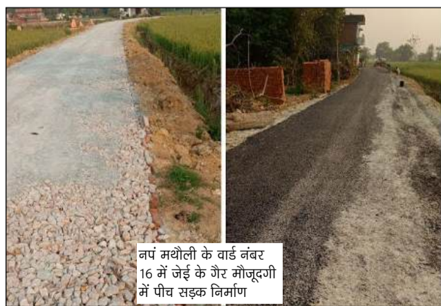
नपं मथौली के वाई नंबर 16 में जेई के गैर मौजूदगी में पीच सड़क निर्माण

पट्ट) नहीं लगाया गया है, जो पारदर्शिता और जवाबदेही पर सीधा प्रहार है। गायब है साइन बोर्ड, छुपा है ठेकेदार का नाम : पीडब्ल्यूडी के नियमों के अनुसार किसी भी निर्माण कार्य की शुरुआत से पहले एक साइन बोर्ड लगाना अनिवार्य होता है, जिसमें परियोजना की लागत, स्वीकृति राशि, ठेकेदार का नाम और पूर्णता तिथि का ब्योरा होता है। लेकिन मथौली के