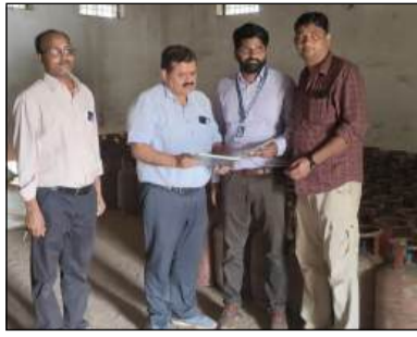
डीएसओ ने गैस गोदामों व प्रतिष्ठानों का किया निरीक्षण