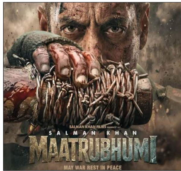
पोस्टर पर और न ही कैप्शन में कहीं भी 17 अप्रैल या कोई भी रिलीज फिल्म की रिलीज डेट भी आगे बढ़ गई है?

कहीं भी फिल्म की रिलीज डेट नजर नहीं आ रही है। न ही फिल्म के डेट नहीं दिख रही है। इसके बाद अब सवाल ये भी उठता है कि क्या 'मातृभूमि' का निर्देशन अपूर्व लांछिया ने किया है। जबकि फिल्म को सलमान खान फिल्मस द्वारा के बैनर तले प्रोड्यूस किया गया है। फिल्म में सलमान खान के साथ चित्रांगदा सिंह भी प्रमुख भूमिका में नजर आएंगी। इसके अलावा फिल्म में गोविंदा के भी नजर आने की संभावना है। यह फिल्म 2020 के दौरान गलवान घाटी में भारत और चीन के सैनिकों के बीच हुई झड़प पर आधारित बताई जा रही है। हाल ही में सलमान खान ने मुंबई में समाजवादी पार्टी के मुखिया अखिलेश यादव से मुलाकात की थी। उनकी मुलाकात की तस्वीर काफी वायरल हो रही है। अखिलेश यादव ने भी सलमान खान के साथ मुलाकात की एक तस्वीर साझा की थी। उन्होंने कैप्शन में सिर्फ 'मुंबई मिलन' ही लिखा था।