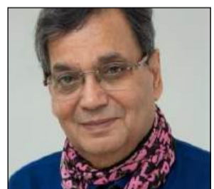
मुंबई। प्रसिद्ध फिल्म निर्माता सुभाष घई के प्रमुख फिल्म संस्थान विल्हिलिंग वुड्स इंटरनेशनल ने स्क्रिनराइटर्स के सहयोग से आज से शुरू होने वाली पांच दिवसीय स्क्रिनराइटिंग वर्कशॉप सीरीज की घोषणा की है। इस पहल के तहत उद्योग के प्रभावशाली कर्तवियों और लीडर्स को एक साथ लाया जा रहा है, ताकि छात्रों को एक गहन और व्यावहारिक सीखने का अनुभव मिल सके। इस पहल में विशेष सत्रों के लिए प्रशस्त फिल्मकारों और क्रिएटिव लीडर्स को आमंत्रित किया गया है, जिनमें श्रीराम राघवन, मोहित सूरी, और ज्यो अख्तर शामिल हैं। इनके साथ उद्योग के कई प्रमुख प्रोफेशनल्स भी शामिल