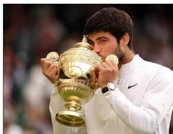
मेदवेदेव ने इस जीत से अल्कारेज और सिनर के बीच एक और फाइनल की संभावना को खत्म कर दिया। मेदवेदेव इससे पहले अल्कारेज के खिलाफ अपने पिछले चार मुकाबलों में हार गए थे, जिनमें

ऑस्ट्रेलियाई ओपन और कतर ओपन के खिताब शामिल हैं। 2024 में इंडियन वेल्स के फाइनल में मिली हार भी शामिल है। मेदवेदेव की 2023 में यूएस ओपन के सेमीफाइनल के बाद यह अल्कारेज पर पहली जीत है। सिनर ने ज़्वेरेव को एक घंटे 23 मिनट में ही हरा दिया। सिनर ने चौथी वरीयता प्राप्त ज़्वेरेव के खिलाफ छह एसेट लगाए। सिनर का ज़्वेरेव के खिलाफ रिकॉर्ड अब 7-4 हो गया है। इस टूर्नामेंट में मेदवेदेव और सिनर दोनों ने ही अभी तक एक भी सेट नहीं गंवाया है। सिनर ने मेदवेदेव के खिलाफ अपने पिछले तीन मैच जीते हैं, जिनमें 2024 में यूएस ओपन के क्वार्टर फाइनल की जीत भी शामिल है। इस बीच महिला युगल के फाइनल में टेलर टाउनसेंड और कैटरिना सिनियकोवा ने अन्ना डैनिलिना और एलेक्जेंड्रा क्रुनिक को 7-6 (4), 6-4 से हराया। पुरुष युगल के फाइनल में गुडो एंड्रेओजी और मैनुअल निनाडी ने आर्थर रिडरकनेच और वैलेंटीन वाचेरोट को 7-6 (3), 6-3 से पराजित किया। मिश्रित युगल में बेरिंडा बेनसिच और फ्लोवियो कोबोली ने शीर्ष वरीयता प्राप्त गैब्रिएला खबोव्स्की और लॉयड ग्लासपूल को 6-3 2-6, 10-7 से हराया।