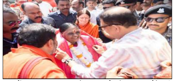
आचार्यों द्वारा अनुष्ठान किए जा रहे अतिथियों के शामिल होने की है, वहीं 7,000 से अधिक विशिष्ट संभावना है।

अयोध्या। प्रसिद्ध आध्यात्मिक गुरु माता अमृतानंदमयी देवी (अम्मा) मंगलवार को अयोध्या पहुंचीं। वे 19 मार्च को श्रीराम मंदिर में होने वाले श्री राम यंत्र प्राण प्रतिष्ठा समारोह में भाग लेंगी। यह आयोजन चैत्र नवरात्रि और हिंदू नववर्ष के शुभारंभ के साथ आयोजित किया जा रहा है। श्री राम जन्मभूमि तीर्थ क्षेत्र ट्रस्ट के आमंत्रण पर अम्मा इस भव्य समारोह में शामिल हो रही हैं। इस अवसर पर देश की राष्ट्रपति द्रौपदी मुर्मू सहित कई प्रमुख संत और आध्यात्मिक नेता भी उपस्थित रहेंगे। मंदिर में पवित्र यंत्र की स्थापना को इसके आध्यात्मिक विकास का एक महत्वपूर्ण पड़ाव माना जा रहा है। करीब 1,200 भक्तों और संन्यासियों के साथ अम्मा का अयोध्या आगमन इस आयोजन को विशेष आध्यात्मिक आयाम प्रदान कर रहा है। इस समारोह में देशभर से आए वैदिक