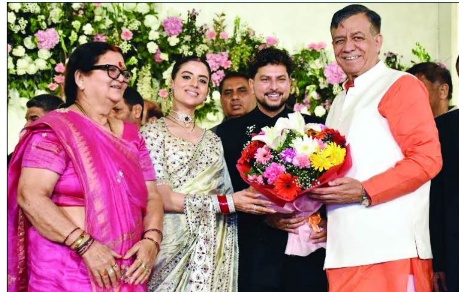
विधानसभा अध्यक्ष सतीश महाना ने भारतीय क्रिकेट टीम के स्टार गेंदबाज कुलदीप यादव के रिसोशन समारोह में सेंट्रल होटल पहुंचकर नवविवाहित जोड़े को आशीर्वाद दिया।

इस अवसर पर उप मुख्यमंत्री ब्रजेश पाठक, जलशक्ति मंत्री स्वतंत्र देव सिंह, पूर्व सांसद रीता बहुगुणा जोशी सहित अन्य गणमान्य नागरिक उपस्थित थे।