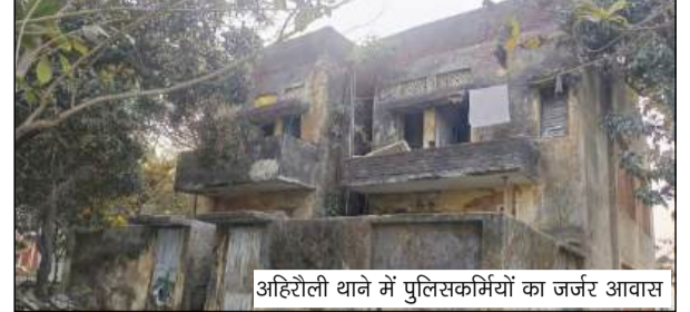
अहिरोली थाने में पुलिसकर्मियों का जर्जर आवास

करीब 40 वर्ष पुराने इस थाना परिसर में उत्तर दिशा में बना एकमात्र बैरक अब खस्ताहाल स्थिति में पहुंच चुका है। हालत इतनी खराब है कि पुलिसकर्मी उसमें रहने से डरते हैं। मजबूरी में मरम्मत कर उसी जर्जर भवन में जीवन यापन कर रहे हैं। ड्यूटी से लौटने के बाद जब जवान आराम करने के लिए कमरे में जाते हैं, तो उनके मन में हंसेशा यह डर बना रहता है कि