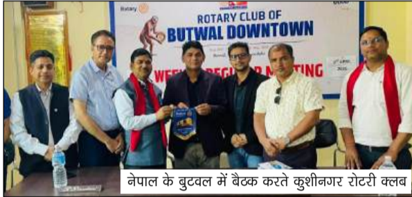
नेपाल के बुटवल में बैठक करते कुशीनगर रोटी क्लब