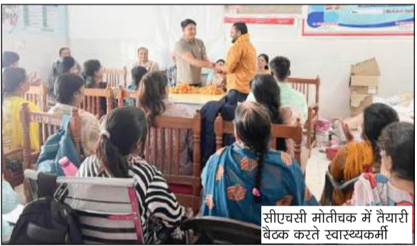
सीएचसी मोतीचक में तैयारी बैठक करते स्वास्थ्यकर्मी