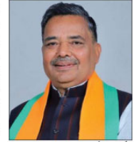
آئی سی سی سیاحت کے لیے 28,780.68 لاکھ روپے کی رقم جاری کی گئی ہے۔

کھنڈ: 9 اپریل - ریاست میں مذہبی سیاحت کے لیے مالی سال 2025-26 کے لیے 68,780.28 لاکھ روپے کی رقم جاری کی گئی ہے۔ مذہبی سیاحت پر پروجیکٹوں کو منظوری دی گئی ہے، جس سے سیاحت کے ترقیاتی کاموں کو فروغ دیا جائے گا۔ سیاحت کے اہتمام کے لیے 28,780.68 لاکھ روپے کی رقم جاری کی گئی ہے۔ مذہبی سیاحت پر پروجیکٹوں کو منظوری دی گئی ہے، جس سے سیاحت کے ترقیاتی کاموں کو فروغ دیا جائے گا۔ سیاحت کے اہتمام کے لیے 28,780.68 لاکھ روپے کی رقم جاری کی گئی ہے۔ مذہبی سیاحت پر پروجیکٹوں کو منظوری دی گئی ہے، جس سے سیاحت کے ترقیاتی کاموں کو فروغ دیا جائے گا۔