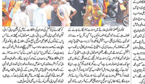
کالوری میں اسمارٹ میٹر کے خلاف خواتین کا احتجاج: سٹیشن کا گھیراؤ۔

کالوری میں اسمارٹ میٹر کے خلاف خواتین کا احتجاج: سٹیشن کا گھیراؤ