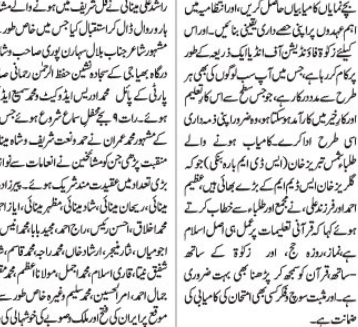
قطب اودھ حضرت مخدوم شاہ مینا شاہ کا ماہانہ نقل شریف منعقد۔

قطب اودھ حضرت مخدوم شاہ مینا شاہ کا ماہانہ نقل شریف منعقد