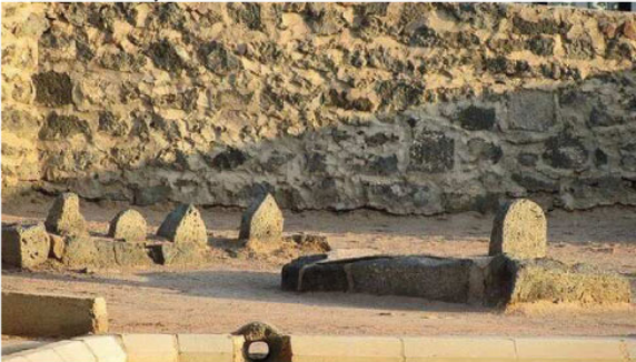
حکیم و مشوروں کی اس اوقات یاد دلا رہا ہے۔

بیتار اور کردار سے پاکیزہ ہونے۔ چتا ہے اور ہر عمل میں اخلاص گزارنے کی کوشش کرتا ہے۔ آخرت میں چار اصولوں پر گزار رہا ہوں۔ جائے ہیں جو دل سے طہین، جلتے ہیں اور دماغ سے