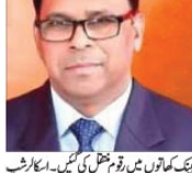
وزیر زمین ریکٹیشن کا وزیر ایسکارٹ، میرن گراٹھ اور مندر فرادی اسکیموں میں نمایاں پیش رفت۔

وزیر زمین ریکٹیشن کا وزیر ایسکارٹ، میرن گراٹھ اور مندر فرادی اسکیموں میں نمایاں پیش رفت