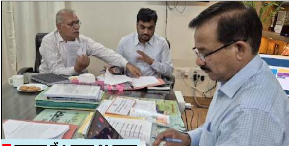
जनपद में 1 लाख 83 हजार वारदाना उपलब्ध, डीएम की सड़न निगरानी

जिलाधिकारी ने कहा कि किसानों की सुविधा सर्वोच्च प्राथमिकता है और खरीद प्रक्रिया पूरी तरह सुव्यवस्थित, समयबद्ध एवं पारदर्शी होनी चाहिए। उन्होंने समस्त उप जिलाधिकारियों को निर्देशित किया कि वे अपने-अपने क्षेत्रों के क्रय केंद्रों का नियमित निरीक्षण कर वारदाना की उपलब्धता, गेहूं उठान की स्थिति तथा