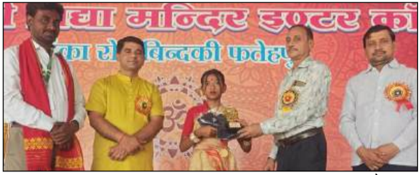
पंचदिवसीय स्काउट-गाइड एडवेंचर प्रतियोगिता का गरिमामय समापन

समापन समारोह प्रातः लगभग 11:30 बजे प्रारंभ हुआ, जिसमें विभिन्न राज्यों से आए स्काउट एवं गाइड के प्रतिभागियों ने अपनी उपस्थिति दर्ज कराई। प्रतियोगिता के दौरान प्रतिभागियों ने विविध साहसिक गतिविधियों में भाग लेते हुए अपने साहस, कौशल, अनुशासन एवं टीम भावना का उत्कृष्ट परिचय दिया। पांच दिनों तक चले इस