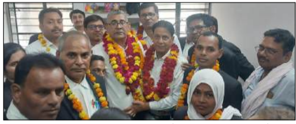
जिला बार एसोसिएशन के नवनिर्वाचित अध्यक्ष का भव्य स्वागत