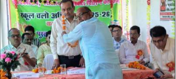
निःशुल्क पुस्तक वितरण की शुरुवात भी हुई