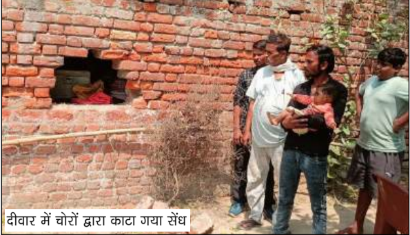
दीवार में चोरों द्वारा काटा गया संध