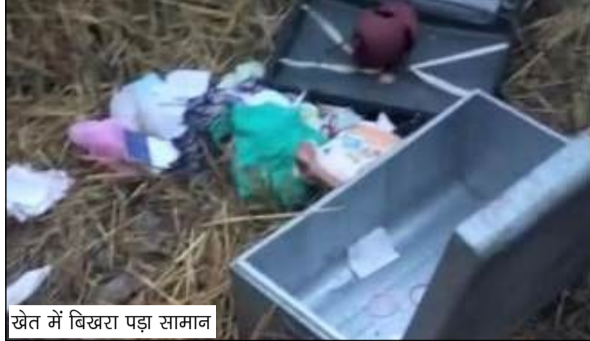
खेत में बिखरा पड़ा सामान

जनकारी के अनुसार चोरों ने घर की साइड दीवार में संध लगाकर मकान के अंदर प्रवेश किया और