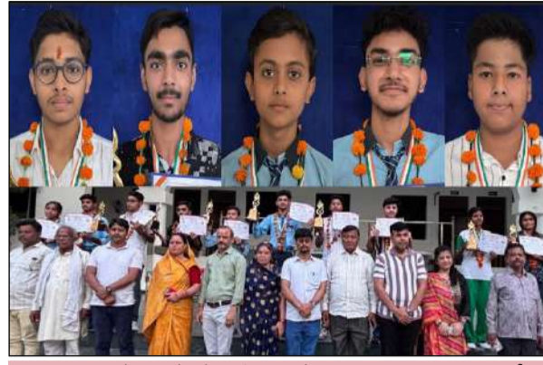
आकाश एजुकेशन के मेधावी एवं मौजूद प्रबन्धक व प्रधानाचार्य।