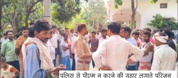
पुलिस से पीएम न करने की गुहार लगाते परिजन