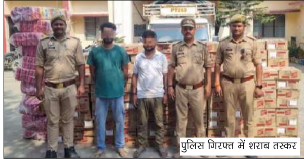
पुलिस गिरफ्त में शराब तस्करो