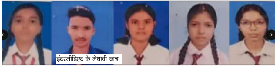
इंटरमीडिएट के मेधावी छात्र