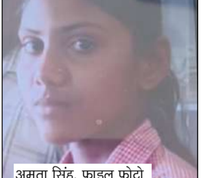
अमृता सिंह, फाइल फोटो