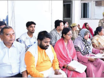
نائب وزیر اعلیٰ کیشو پری ساد مورہ نے جنتادارشن میں سینکڑوں شکایت کنندگان کی شکایتیں سنیں۔

جنتادارشن کے دوران جنتادارشن میں سینکڑوں شکایت کنندگان کی شکایتیں سنیں۔ نائب وزیر اعلیٰ کیشو پری ساد مورہ نے جنتادارشن میں سینکڑوں شکایت کنندگان کی شکایتیں سنیں۔