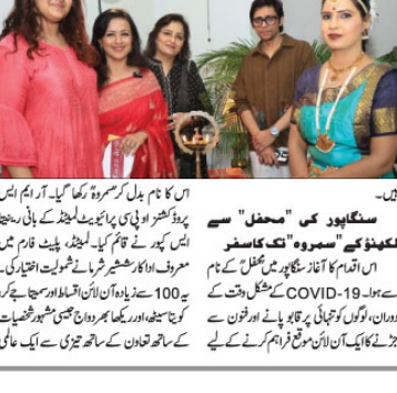
’سمرہ- فنکاروں کا اجتماع‘ کے ہندوستانی باب کافن اور ثقافت کے ایک نئے سنگم کا آغاز۔

’سمرہ- فنکاروں کا اجتماع‘ کے ہندوستانی باب کافن اور ثقافت کے ایک نئے سنگم کا آغاز۔ انہوں نے کہا کہ مذہبی مقامات کے تحفظ سے عقیدت مندوں کی تعداد میں اضافہ ہوگا، سیاحت کو فروغ ملے گا اور روزگار کے مواقع پیدا ہوں گے۔