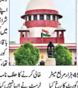
سپریم کورٹ نے آسام ٹرسٹ کو راحت دی۔ انہوں نے کہا کہ سپریم کورٹ نے آسام ٹرسٹ کو راحت دی۔

دہلی، 27 اپریل (ای این آئی) سپریم کورٹ نے آسام ٹرسٹ کو راحت دی۔ انہوں نے کہا کہ سپریم کورٹ نے آسام ٹرسٹ کو راحت دی۔ انہوں نے کہا کہ سپریم کورٹ نے آسام ٹرسٹ کو راحت دی۔