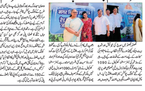
شہر کے اہم چوراہوں پر خصوصی کولنگ سینیٹر قائم۔

شہر کے اہم چوراہوں پر خصوصی کولنگ سینیٹر قائم۔ انہوں نے کہا کہ مذہبی مقامات کے تحفظ سے عقیدت مندوں کی تعداد میں اضافہ ہوگا، سیاحت کو فروغ ملے گا اور روزگار کے مواقع پیدا ہوں گے۔