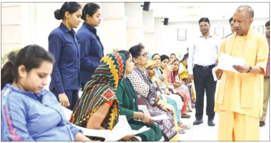
سی ایم یوگی نے سنی شکایت، حکام کو دیا الٹی میٹم۔ ان کی سماعت کے بارے میں بھی دریافت کیا۔ جب انہیں معلوم ہوا کہ کچھ لوگ بار بار سامنے آ رہے ہیں تو انہیں بتایا کہ ان کے مسائل کو حل کرنے کے لیے وہ اپنی ذمہ داری ادا کریں۔

شعبہ کے افسران کو اپنے مسائل بتائیں۔ جس سے ہائیڈرو پمپ کے بحال میں مقامی سطح پر سماعت اور قراردادوں کو جھنجھٹا بنایا جائے۔ 'یوگی آجیہ ہاتھ جو ایک سخت قسم کے طور پر سماعت رکھتے ہیں، نے بھی جنتادارشن کے دوران انتہائی نرم رویہ دکھا کر دکھایا۔ چوتھے دن کو ان کی کوششوں میں مددگار بن گیا۔ چوتھے دن کو ان کی کوششوں میں مددگار بن گیا۔ چوتھے دن کو ان کی کوششوں میں مددگار بن گیا۔