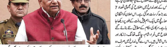
سرگرمیوں کے دوران لداخ کے اضلاع کا اعلان کیا گیا

کل تعداد سات ہونی؛ انتظامی ڈھانچے میں بڑی تبدیلی