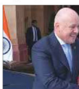
وزیر اعظم نے لکھنؤ میں ہند-نیوزی لینڈ ایف بی اے پر دستخط سے قبل وزیر اعظم لکھنؤ میں۔

لکھنؤ، 27 اپریل (ای این آئی) وزیر اعظم نے لکھنؤ میں ہند-نیوزی لینڈ ایف بی اے پر دستخط سے قبل وزیر اعظم لکھنؤ میں۔ انہوں نے کہا کہ وزیر اعظم نے لکھنؤ میں ہند-نیوزی لینڈ ایف بی اے پر دستخط سے قبل وزیر اعظم لکھنؤ میں۔