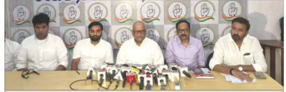
کانگریس ایم پی کی بھوک بھارت 17 گھنٹوں بعد ختم

پری پینڈا اسمارٹ میٹر پر کانگریس کی تہذیبی صارفین پر بھوک بھارت چارہ پالیسی کے تحت سبز چارہ پیداوار کے لیے 3 کروڑ روپے منظور