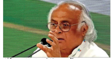
ای ڈی کارروائیوں پر سوالیہ ٹرمپ کے ہندوستان مخالف تبصرے پر پوچھ گچھ کا گمرگس نے ہریانہ کے خصوصی اجلاس کا بیجاٹ کیا مقرر ای اجلاس

نئی دہلی: جے رام ریش نے ہندوستان کے 7 ارکان کے بی جے پی میں انضمام پر جے رام ریش کا حملہ کیا۔ جے رام ریش نے ہندوستان کے 7 ارکان کے بی جے پی میں انضمام پر جے رام ریش کا حملہ کیا۔ جے رام ریش نے ہندوستان کے 7 ارکان کے بی جے پی میں انضمام پر جے رام ریش کا حملہ کیا۔ ای ڈی کارروائیوں پر سوالیہ ٹرمپ کے ہندوستان مخالف تبصرے پر پوچھ گچھ کا گمرگس نے ہریانہ کے خصوصی اجلاس کا بیجاٹ کیا مقرر ای اجلاس ای ڈی کارروائیوں پر سوالیہ ٹرمپ کے ہندوستان مخالف تبصرے پر پوچھ گچھ کا گمرگس نے ہریانہ کے خصوصی اجلاس کا بیجاٹ کیا مقرر ای اجلاس