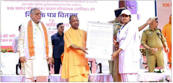
کھنڈ: 28 اپریل، وزیر اعلیٰ کی زیر اہمیت پولیس محکمہ مواصلات کے 936 منتخب چیف آپریٹرز/ چیف آپریٹرز (میکینیکل) کو تقرری نامہ تفویض کیے جانے کی تقریب کا سب سے اہم اجلاس منعقد ہوا۔ پولیس اور دیگر فورسز کی زیادہ اختیار ہونے کی، جو اس وقت کے وزیر اعلیٰ نے اتر پردیش پولیس کے لیے کی گئی تھی۔

وزیر اعلیٰ نے اتر پردیش پولیس محکمہ مواصلات کے 936 منتخب چیف آپریٹرز/ چیف آپریٹرز (میکینیکل) کو تقرری نامہ تفویض کیے