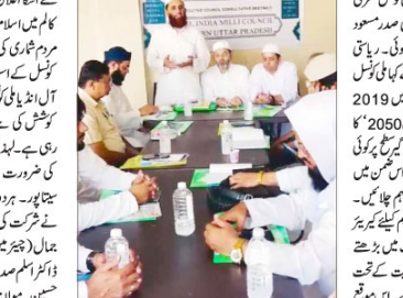
کھنڈ: 28 اپریل، آل انڈیا ملی کونسل کی ریاستی مجلس عاملہ کی میٹنگ میں علماء و دانشوران کی شرکت۔

آل انڈیا ملی کونسل کی ریاستی مجلس عاملہ کی میٹنگ میں علماء و دانشوران کی شرکت