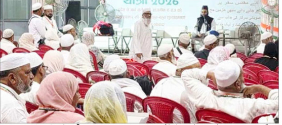
کھنڈ: 28 اپریل، لکھنؤ میں جاہلین جگہ کی تربیتی نشست کا سلسلہ جاری۔ علماء نے مناسک حج اور دینہ منورہ کے آداب تفصیل سے بیان کیے۔

علماء نے مناسک حج اور دینہ منورہ کے آداب تفصیل سے بیان کیے