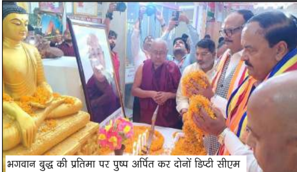
भगवान बुद्ध की प्रतिमा पर पुष्प अर्पित कर दोनों डिप्टी सीएम

कुशीनगर। बुद्ध पूर्णिमा के अवसर पर आयोजित कार्यक्रम में प्रदेश सरकार के उप मुख्यमंत्री ब्रजेश पाठक ने कहा कि भगवान गौतम बुद्ध का संदेश आज भी पूरी दुनिया के लिए मार्गदर्शक है। कोई भी संघर्ष युद्ध से नहीं बल्कि बुद्ध के विचारों और अहिंसा के मार्ग से जीता जा सकता है।